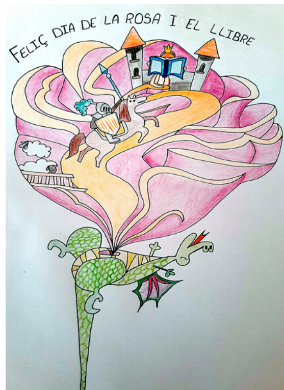
Lisbeth Pico (3r d'ESO D)

La matrícula de l'ESO per al curs 2020-21 tindrà lloc entre el dilluns 13 i el divendres 17 de juliol